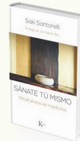
Sánate tu mismo Saki Santonelli Ed. Kairós